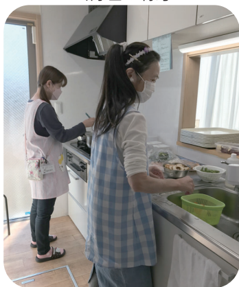
ぷちぷち職員と利用者様 の調理の様子