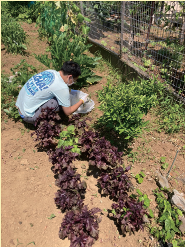
畑作業は大変ですが、目に見える野菜の成長を実感できます。