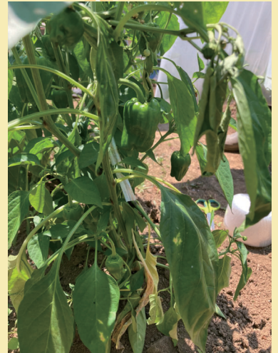
立派なピーマンです。