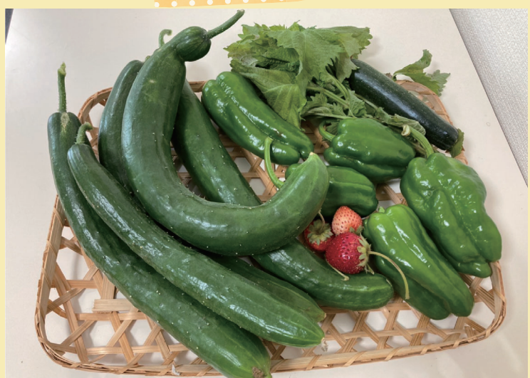
収穫したイチゴ・キュウリ・ズッキーニ・ピーマンです。大満足の出来です。