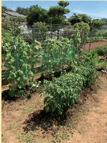
すっかり大きく育ちました。